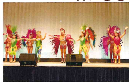
コバカバーナ・サンバチーム